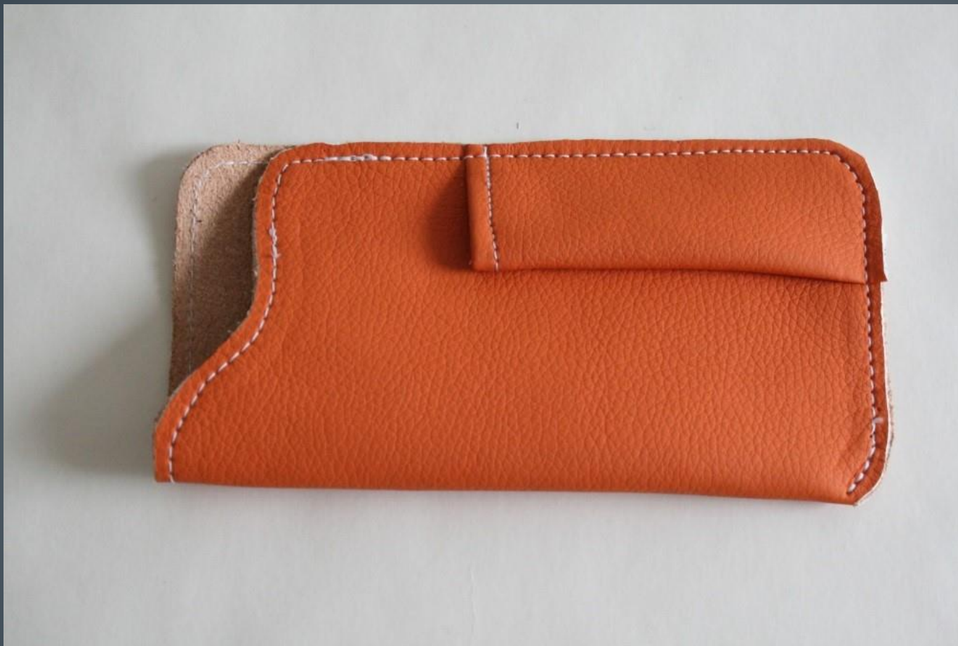
Jakub Hřebíček – pouzdro na brýle