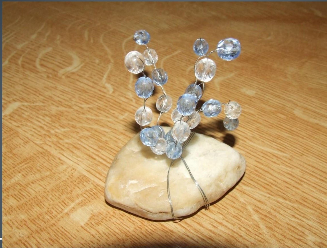
Kateřina Sochovnkov sromeek z korlk