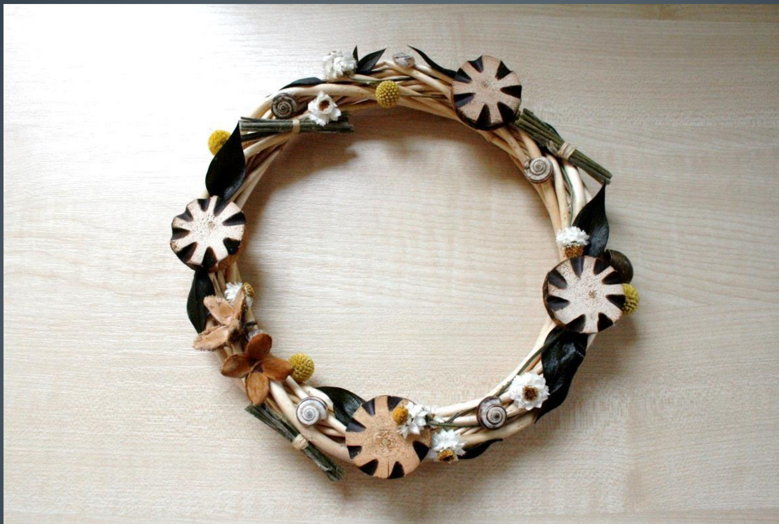
Luboš Mikliš – věneček z přírodnin