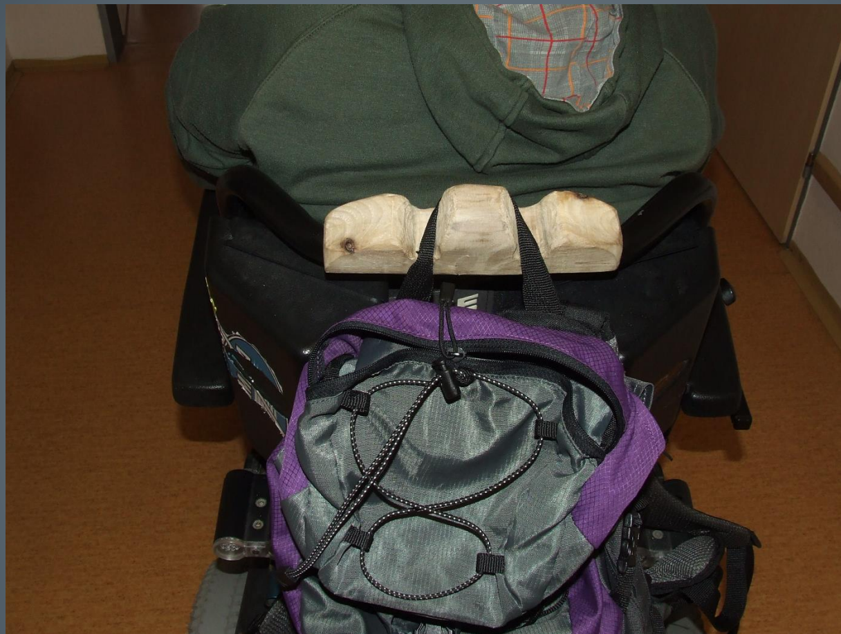
Lukáš Vintr – držák na batoh